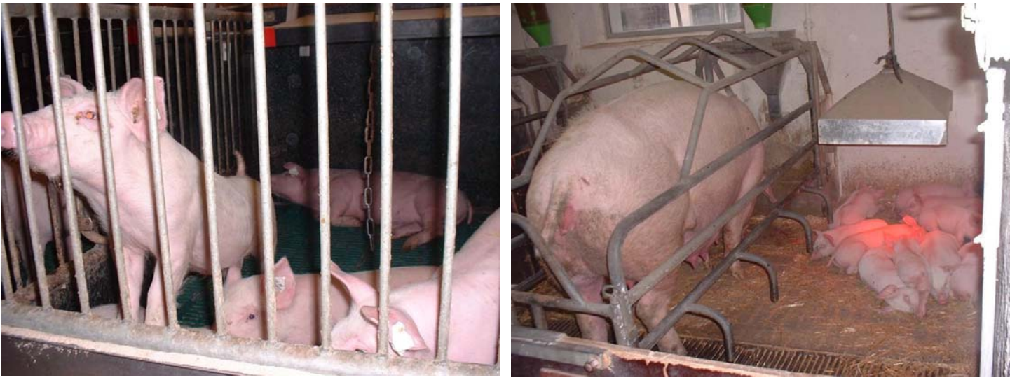
Tierversuche für die Produktion von "Schweinefleisch"

Und besser als den Versuchstieren, ob Ratten, Mäusen, Affen, Hunden oder Katzen, geht es den Opfern der nicht vegan lebenden Menschen in der "Mast", Ei- oder Milch"produktion" – Hühnern, Schweinen, Fischen, Rindern, Schafen, Kaninchen usw., übrigens ebenfalls Spezies, mit denen auch Tierversuche für andere Zwecke als Ernährung durchgeführt werden –, keineswegs, wie Bilder aus ihrem Alltag zeigen (dokumentiert unter www.tierrechtsbilder.de ), im Gegenteil.